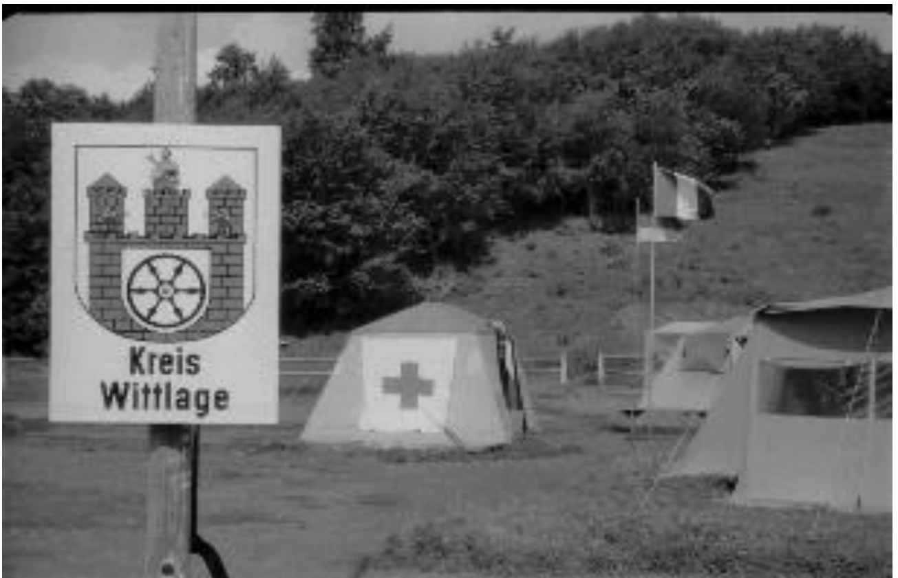
Blick auf den Zeltplatz mit dem Wittlager Wappen (1966)