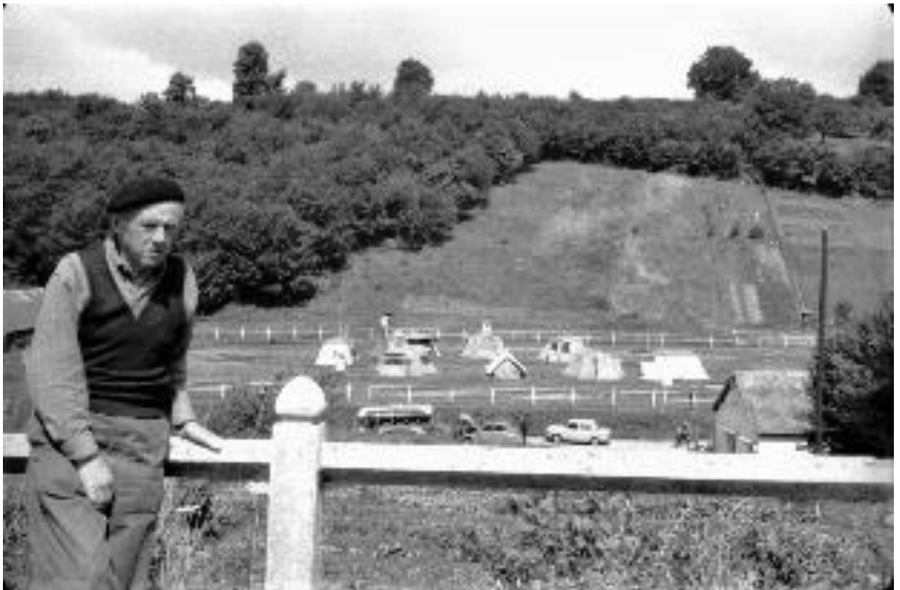
Das erste JRK Zeltlager auf dem damaligen Sportplatz in Bolbec