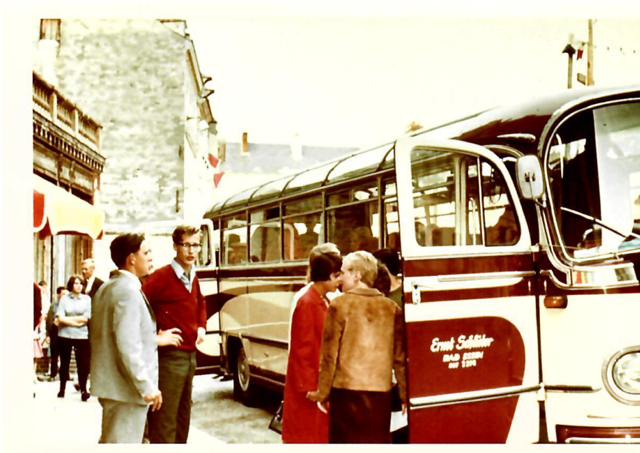
Mit dem Bus der Firma Ernst Schlüter aus Bad Essen ging die Fahrt nach Bolbec